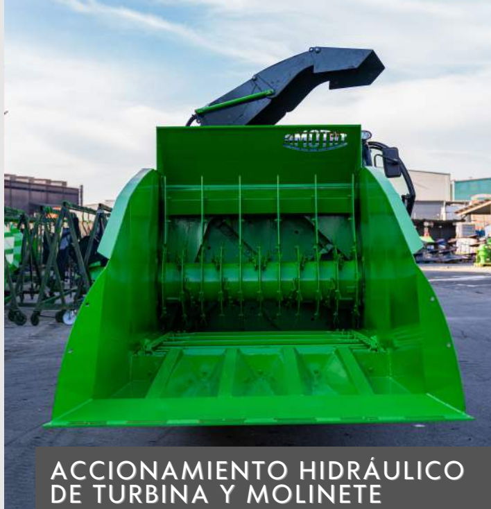
ACCIONAMIENTO HIDRÁULICO DE TURBINA Y MOLINETE