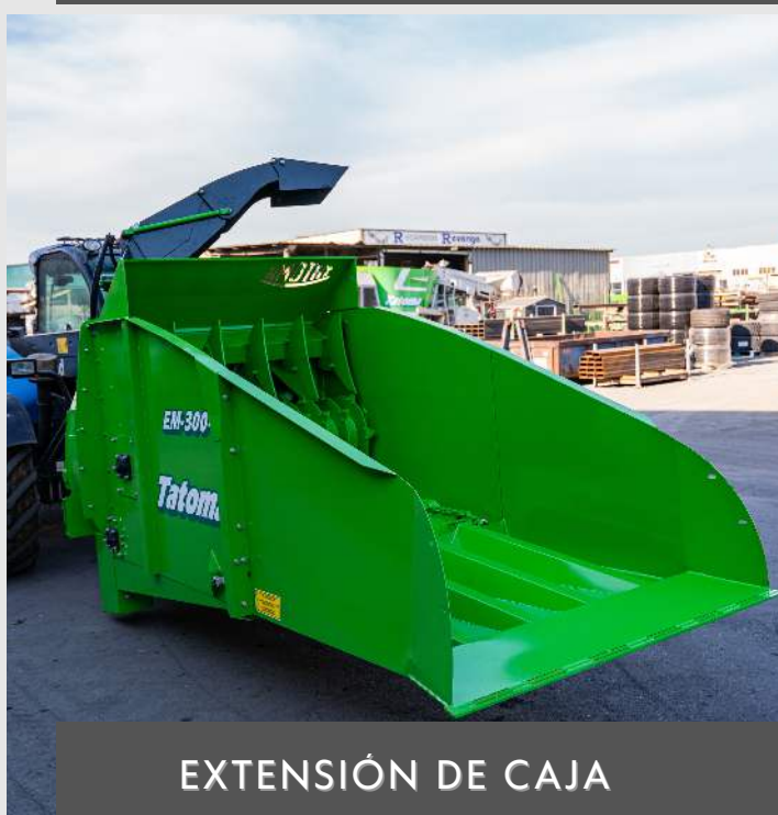
EXTENSIÓN DE CAJA