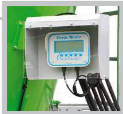
Pantalla de la báscula (opcional programable).