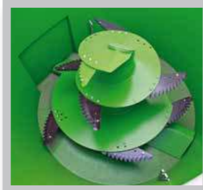
Sinfín equipado con cuchillas dentadas de alta resistencia.