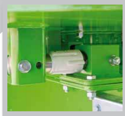
Tres células de pesaje.