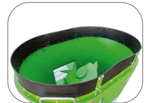
Anillo antidesbordamiento de goma