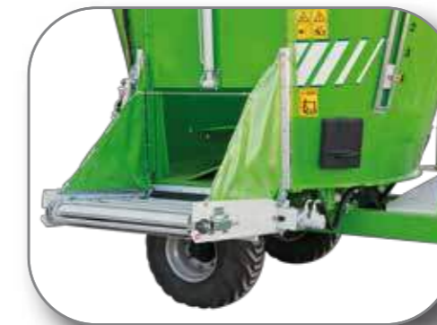
Cinta de descarga en puerta lateral con elevación hidráulica

con fibra larga. Tras años de experiencia en el sector TATOMA ha desarrollado un sinfín capaz de trabajar con cualquier tipo de mezcla garantizando la máxima homogeneidad y una distribución ideal. La espiral inferior de gran diámetro nos asegura una descarga regular cualquiera que sea el tipo de mezcla. A su vez la combinación entre el paso de las espiras y el diámetro de las mismas nos garantiza un perfecto movimiento del producto, un corte rápido y eficiente, un bajo consumo de combustible y un vaciado completo y regular de la cuba.